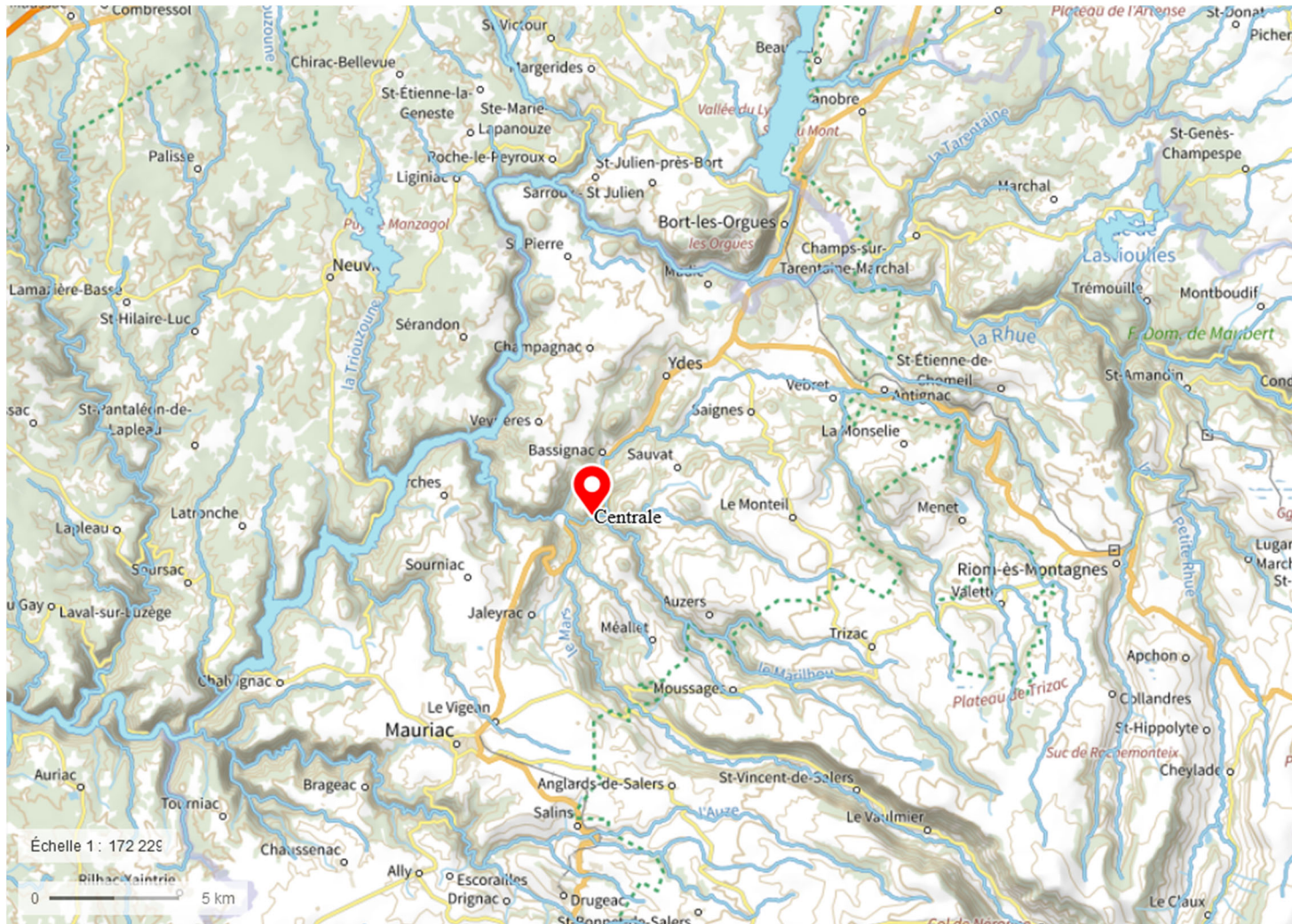
Plan 1 – Localisation projet